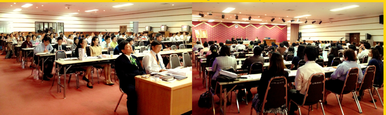
บรรยายภาคการเสวนาวิชาการ ผู้สนใจจากทั้งหน่วยงานภายใน และภายนอกมหาวิทยาลัย